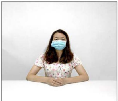
图2：正前方第一机位效果图