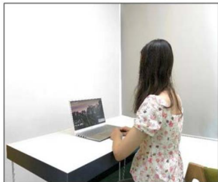
图3：侧后方第二机位效果图